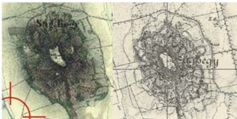
1. ábra A Ság-hegy a II. és III. katonai felmérés térképén Fig. 1. The Ság-mountain on the maps of the II. and III. military survey

Hadászati célokból és Magyarország területének jobb megismerése céljából a 18. és 19. században három katonai felmérést is végeztek. Az elsőt 1780 és 1784 között, a másodikat 1806 és 1869 között, a harmadikat pedig 1869 és 1887 között. Megvizsgálva a II. és III. katonai felmérések térképeit (1. ábra), amelyek abban a korban készültek, amikor a Ság-hegyi barlang első leírásait közreadták, megállapítható, hogy a barlang egyik térképen sem volt feltüntetve.