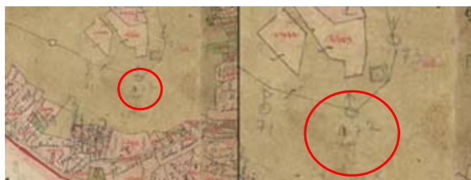
2. ábra A Ságüreg jelkulcsi jelölése a Ság-hegy 1857-ben készített kataszteri szelvényén, a bejárat pirossal bekarikázva (forrás: Arcanum Adatbázis Kft.: Vas megye az első kataszteri felmérés térképein 1856 – 1860) Fig.2. The symbol of the Ságüreg on the cadastral map from 1857(source: (forrás: Arcanum Adatbázis Kft.: Vas megye az első kataszteri felmérés térképein 1856 – 1860)