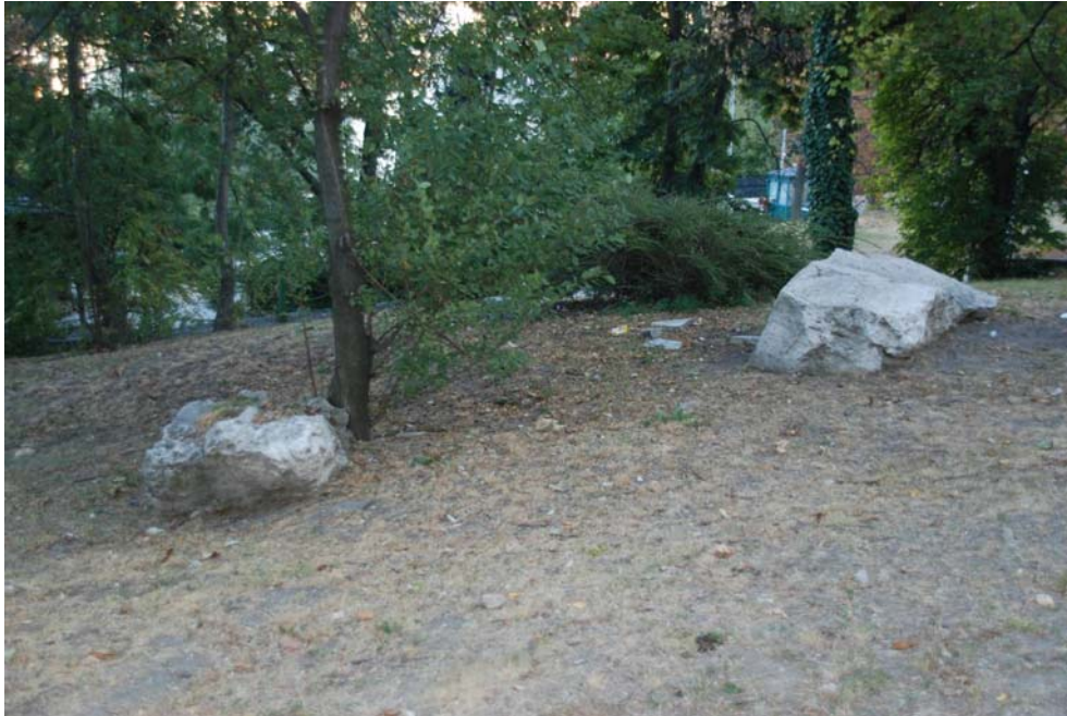
2.kép. Lejtőn legurult édesvízi mészkőtömbök Picture 2. Rolled down freshwater limestone boulders.

A szálban álló édesvízi mészkő felszínének tengerszint feletti magassága változó: a legmagasabban a hajdani források közvetlen közelében a mai Szentháromság téren fordul elő a kőzet (167-170 m közt), innen északra kicsit, délre erősebben lejt a felszíne (a plató északi részén magassága 160-164 m tszf, a Várpalota alatt 152-154 m tszf.). A déli rész alacsonyabb orográfiai magasságának DÉNES (1975) szerint az a magyarázata, hogy az elsősorban a mai Szentháromság tér környékén feltörő meleg vizes források vize déli irányban lefelé folyt (az Ördög-árok bevágódásához kapcsolódóan).