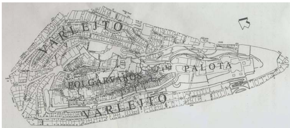
1. ábra. A budai Vár térképe Fig. 1. Map of the Buda Castle.

Régészeti kutatások szerint régóta lakott hely a Vár-hegy. Már 350.000 éve az itt fakadó meleg vizes forrásoknál vert tanyát a „Buda kultúráját” képviselő ősember (VÉRTES, 1965). A mai beépítettség kialakítása IV. Béla parancsára történt a tatárjárás után, az 1240-es-1250-es években. A Vár-hegy használatilag azóta két részre tagolódik: déli végét foglalja el a királyi palota épületegyüttese, a jelenlegi Dísz-tértől északra pedig a Polgárváros utcái húzódnak. A Vár-barlang járatai teljes egészben a Polgárváros alatt találhatóak, a palota alatt nem ismerünk természetes barlangüreget.