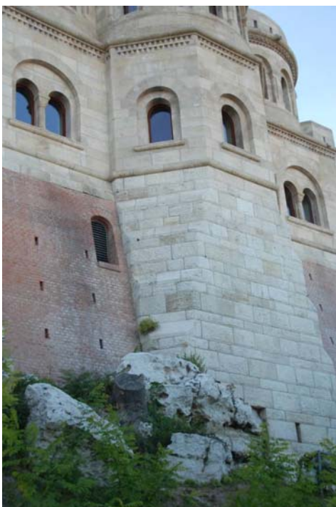
1. kép. Kibukkanó édesvízi mészkő a Halászbástya alatt Picture 1. Outcrop of the freshwater limestone under the Fisherbastion.

teljesen vízszintes településű – ez jól megfigyelhető a Halászbástya egyes pontjai alatt kibukkanó közetrétegeken (1. kép).