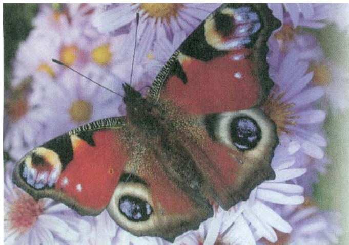
3. kép: Nappali pávaszem ( Inachis io ) a szabadban Picture 3: European Peacock ( Inachis io ) afield

rült. A Triphosa haesitata észak-amerikai barlangokban fordul elő ( GINET – DEGOU 1977, LENGERSDORF 1957 ).