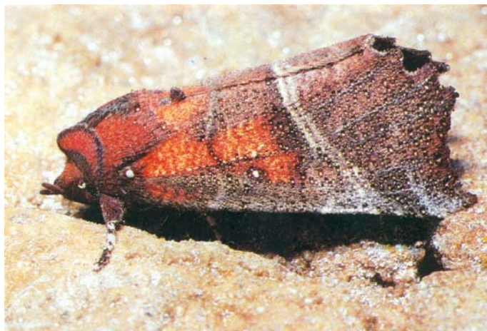
2. kép: A telelő vörös csipkésbagoly ( Scoliopteryx libatrix ) testén lecsapódó vízcseppek vannak Picture 2: Precipitated waterdrops on the body of a wintering Herald Moth ( Scoliopteryx libatrix )

vok) vannak. Pihenés közben szárnyaikat háztetőszerűen tartják. A kifejlett lepkék a nyári napokban is pihennek a barlangok falán, de a barlangokban (pincékben) való telelés az általános. Hernyói csupaszok, a talajban laza kokont szőve bábozódnak. A hernyók csak a fűzfafélék ( Salicaceae ) leveleit eszik. Kedvelt gazdanövényük a kecskefűz ( Salix caprea ) és a rezgő nyár ( Populus tremula ), mely növények kizárólag csak mészsímentes talajokon élnek.