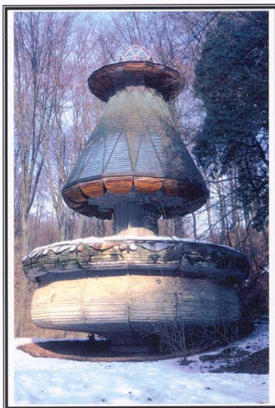
1. kép: A Gomba (szivattyúház) Picture 1. The „Gomba” (house of pump)

A Vízfő-forrás barlangja a többi idegenforgalmi barlanghoz képest nem jelentős nagyságú, ezt azonban ellensúlyozza a rendkívül kedvező fekvése, különösen a jó megközelítési lehetősége és a kapcsolódó, már működő idegenforgalmi létesítmények közelsége. A viszonylag kis méret mellett értéke az is, hogy a barlanghoz tartozik, a barlanggal szorosan és szervesen együtt található „Gomba” nevű objektum, amely védett ipartörténeti emlék (Csete György egyik remek alkotása) (1. kép). A „Gomba” és a szivattyúház szerves egységet képez a barlanggal, hiszen a vízkiemelés céljára építettek itt